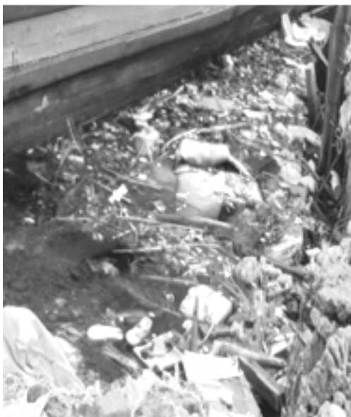
Gambar 8. Kondisi sampah yang berada di pinggir laut Pulau Tidung