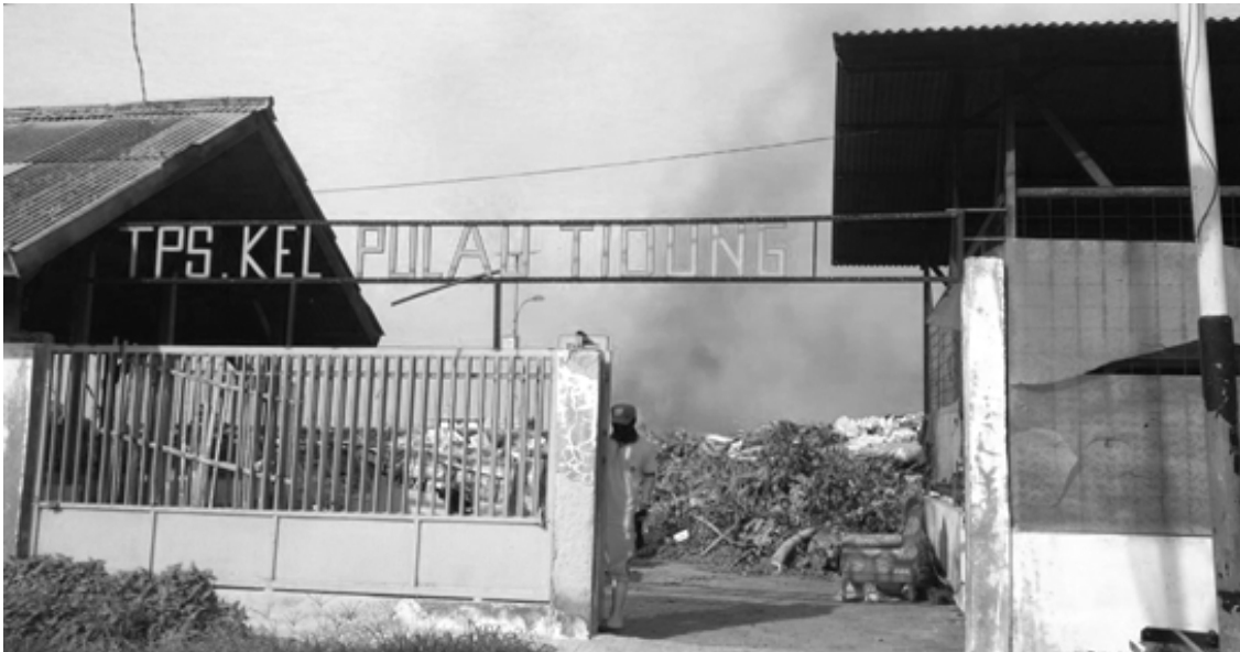
Gambar 4. TPS KEL. Pulau Tidung

Dengan tingginya intensitas wisatawan ke Pulau Tidung, penggunaan styrofoam sebagai pembungkus