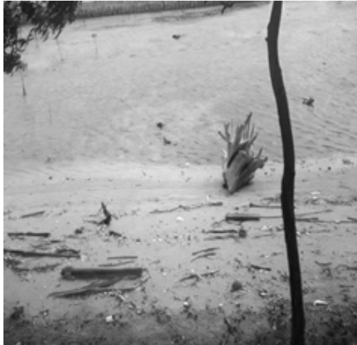
Gambar 6. Kondisi pinggir pantai menuju jembatan cinta