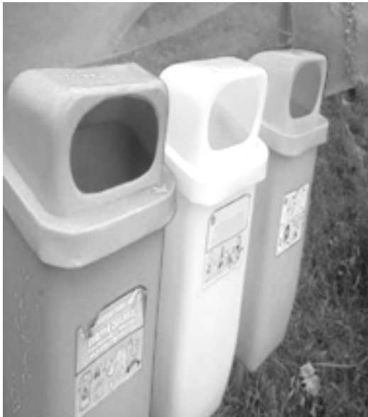
Gambar 7. Tempat sampah di Pulau Tidung