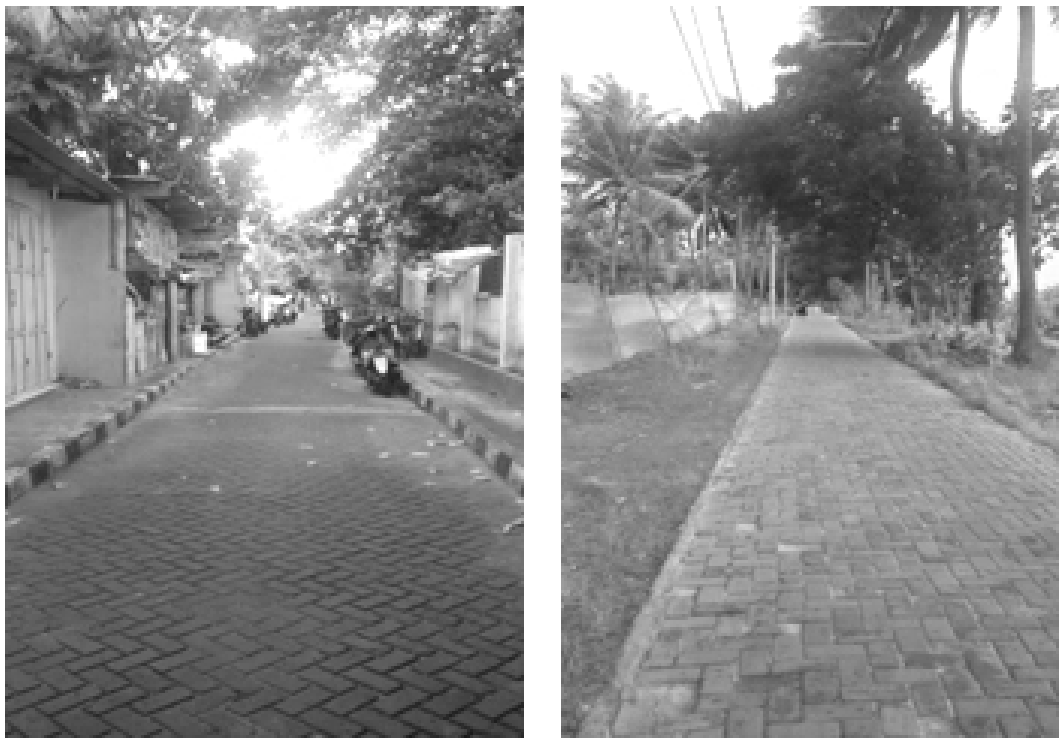
Gambar 3. Kondisi jalan di Pulau Tidung