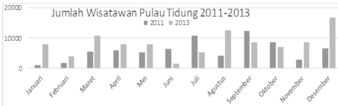
Gambar 1. Data Kunjungan Wisatawan ke Pulau Tidung 2011-2013