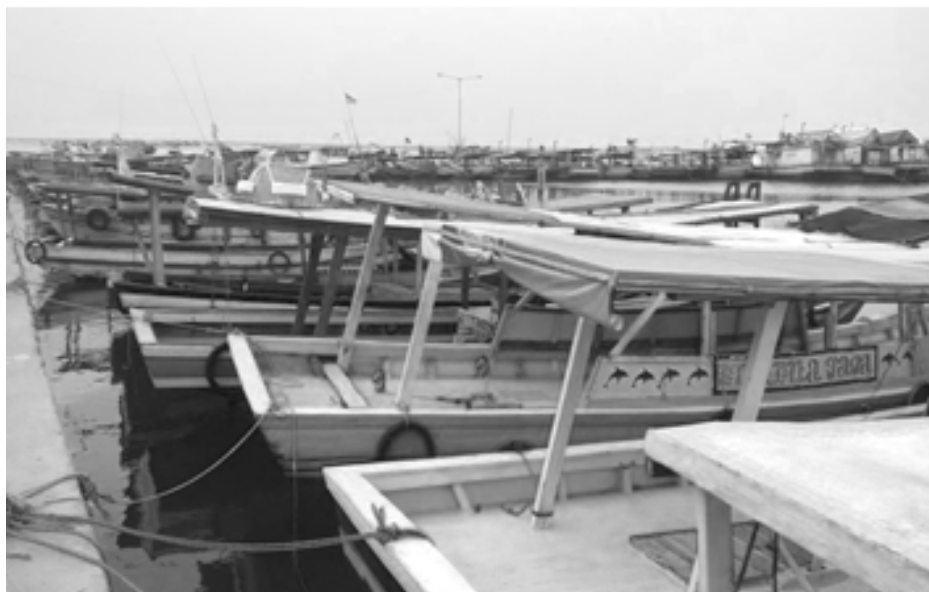
Gambar 5. Dermaga Utara Pulau Tidung